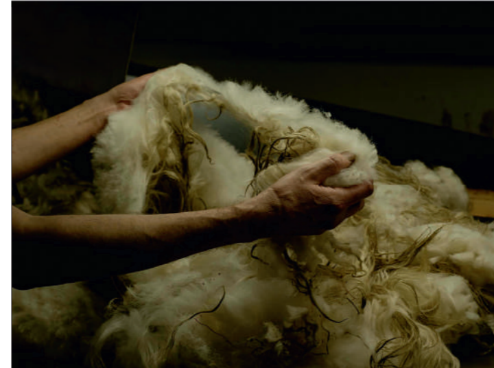
Kvalitet og bæredygtighed spiller en stor rolle for de anvendte materialer. I samarbejde med førende Skandinaviske producenter kan Flokk tilbyde en række bæredygtige uld-tekstiler, hvilket giver en bæredygtig løsning til vores stoleserier.